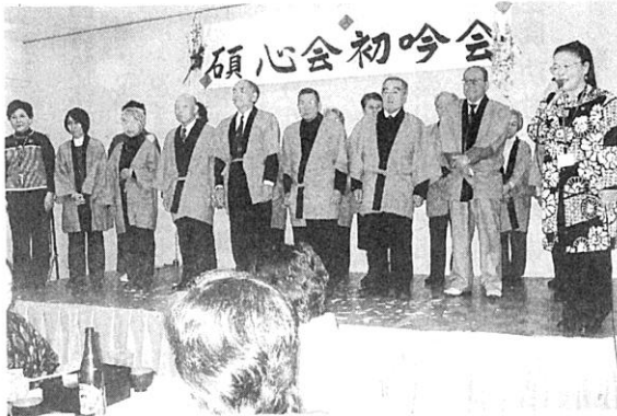
懇親会担当の静朗・葦風支部 お疲れさま