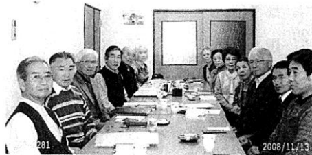
ある日の教室風景

年に何度か教室での指導方法を各自に聞き、話し合い、心の通い合う教室であることを目標にしております。又、親睦を深めるために春は桜花会、懇親会等のイベントを計画し教室の輪を大切に活動を行きたく思います。