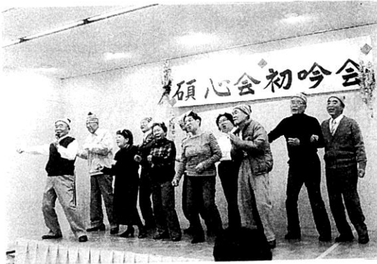
りんごの歌等の構成童謡 (滝の坂支部)