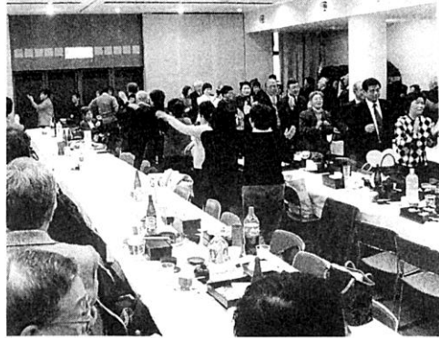
フィナーレの炭坑節