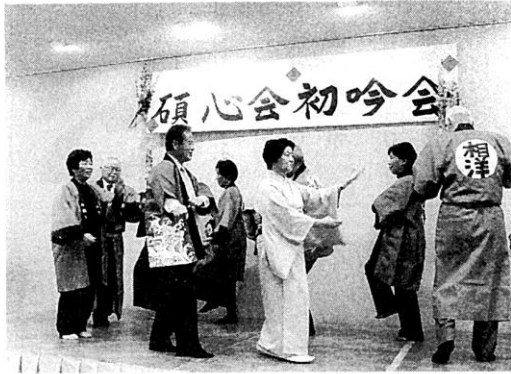
片瀬江ノ島音頭 (相洋支部)

午後から懇親会が行 われ、音頭・踊り・カ ラオケ等周到に準備さ れた多彩な芸が次々と 繰り広げられ、最後に 全員で炭坑節を踊り、 昨年来の不況を吹き飛 ばす程の極めて楽しい 有意義な初吟会となり ました。 広報部 高見