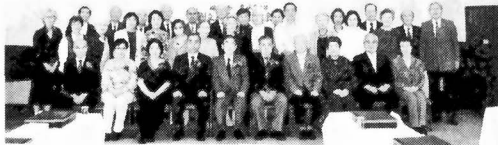
来賓、家族ともども、盛会であった20周年記念大会